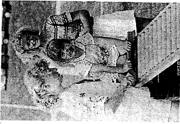
EIN MAGNET beim Kindernachmittag des MVÖ war die Rollenrutsche (linkes Bild). Abends sorgte das „Karawanken-Quintett“ für Stimmung; als echter Gag erwies sich dabei der Auftritt des Bert (rechts).

WEHR (to). Anders als bekanntgeben trifft sich der Schwarzwalddverein am Mittwoch, 19. Juli, erst um 8.10 Uhr am Bahnhof Wehr, um in Fahrergemeinschaften nach Rickenbach fahren. Die geplante Wanderung auf dem Hotzenwaldquerweg wird gehärteteren Wanderern empfohlen. Rucksackverpflegung ist erforderlich.